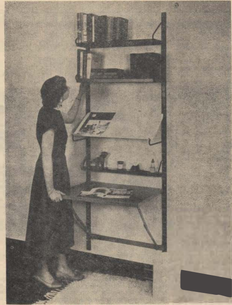
Dit bereikt U met